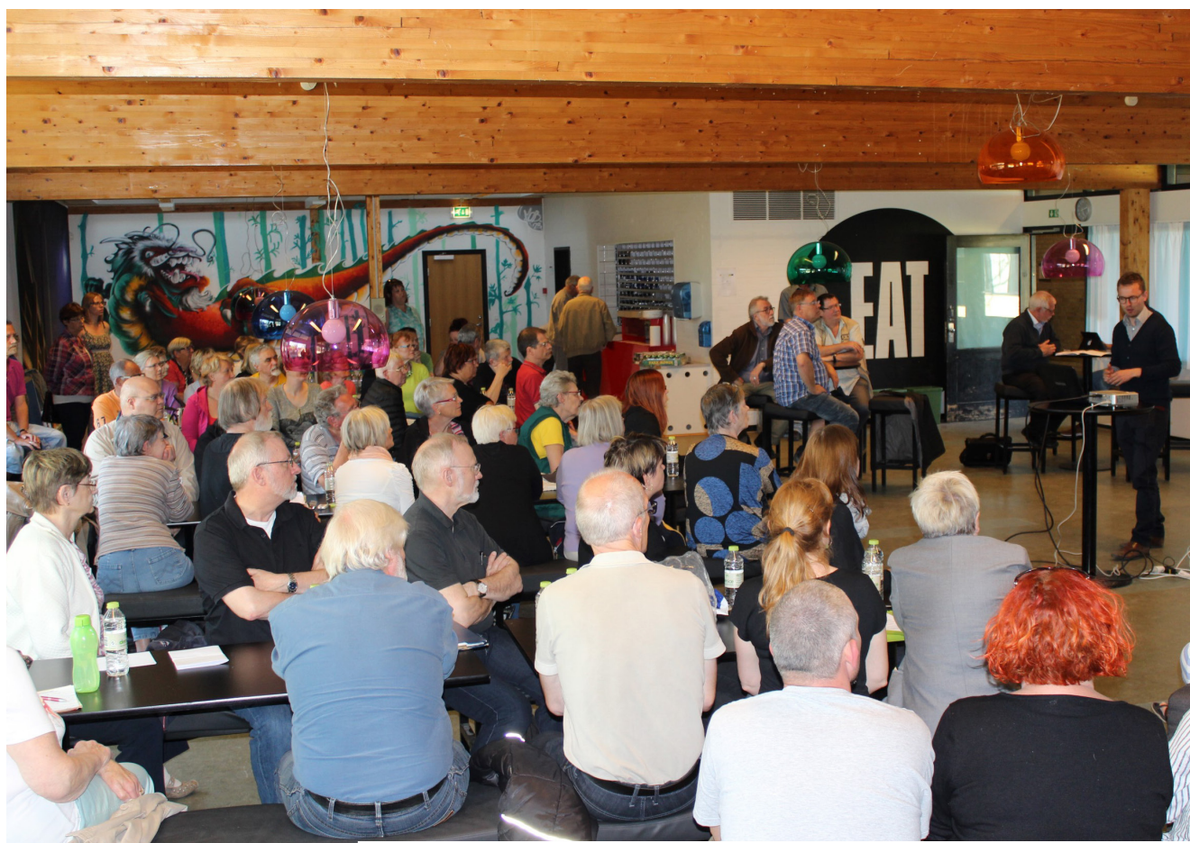
BEBOERMØDE April 2014