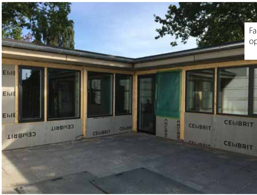
Facader er klar til at blive opbygget.