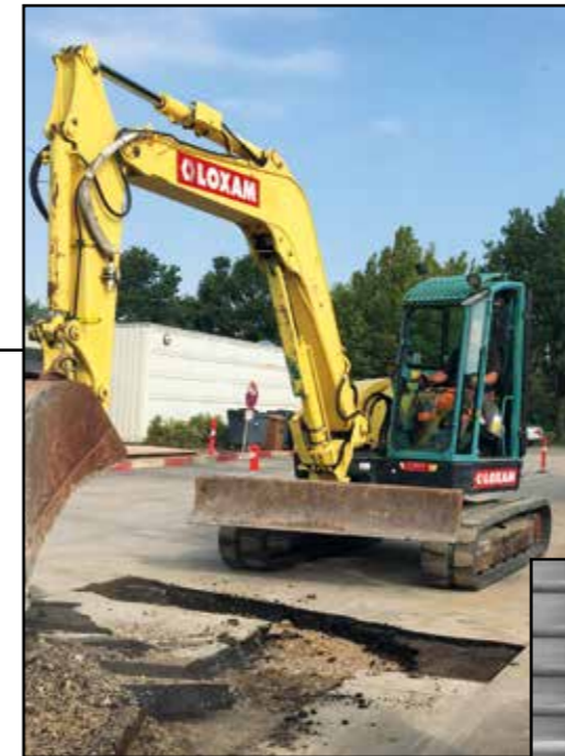
Forsyningsarbejder i Hvedens Kvarter, sensommeren/efteråret 2018.

På de næste sider kan du se stemningsbilleder fra året, der er gået.