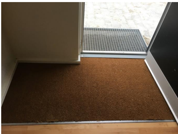
Ny løsning med nedfældet dørmåtte i fuld bredde

Vi er dog ikke helt færdig med at lære! Der bliver lavet en anden løsning i entréen, hvor det lave dørtrin har gjort det vanskeligt at placere dørmåtten hensigtsmæssigt. Derfor er det besluttet, at der etableres nedfældede måtter i fuld bredde i alle boliger. Dette gælder også i de indflyttede boliger, hvor beboerne naturligvis vil blive varslet i god tid.