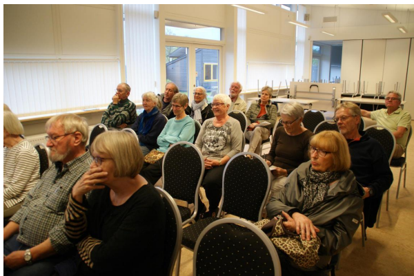
Der blev både talt og lyttet i en god stemning

Renoveringen af Kastanjens Kvarter har været en lang læreproces for alle involverede på både godt og ondt. Beboerne var derfor den 9. maj inviteret til at dele deres oplevelser med entreprenører, rådgivere og BO-VEST ved et evalueringsmøde.