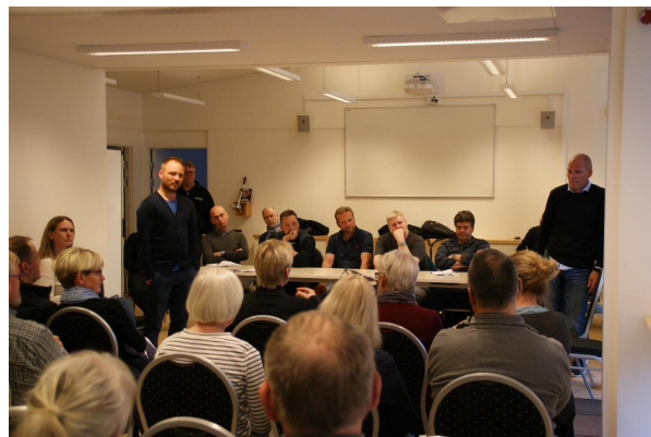
Beboernes oplevelser gjorde indtryk

Beboerne blev forsikret om, at ingen bliver glemt, og at alle fejl og mangler bliver udbedret snarest muligt.