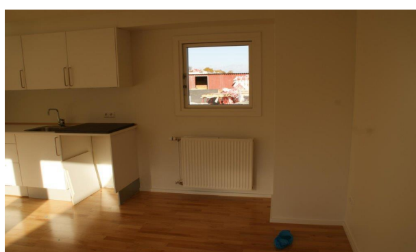
Tre køkkener med forskelligt materialevalg