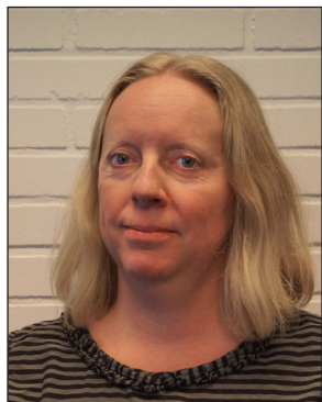
Boligudlejningen Giv Andersen