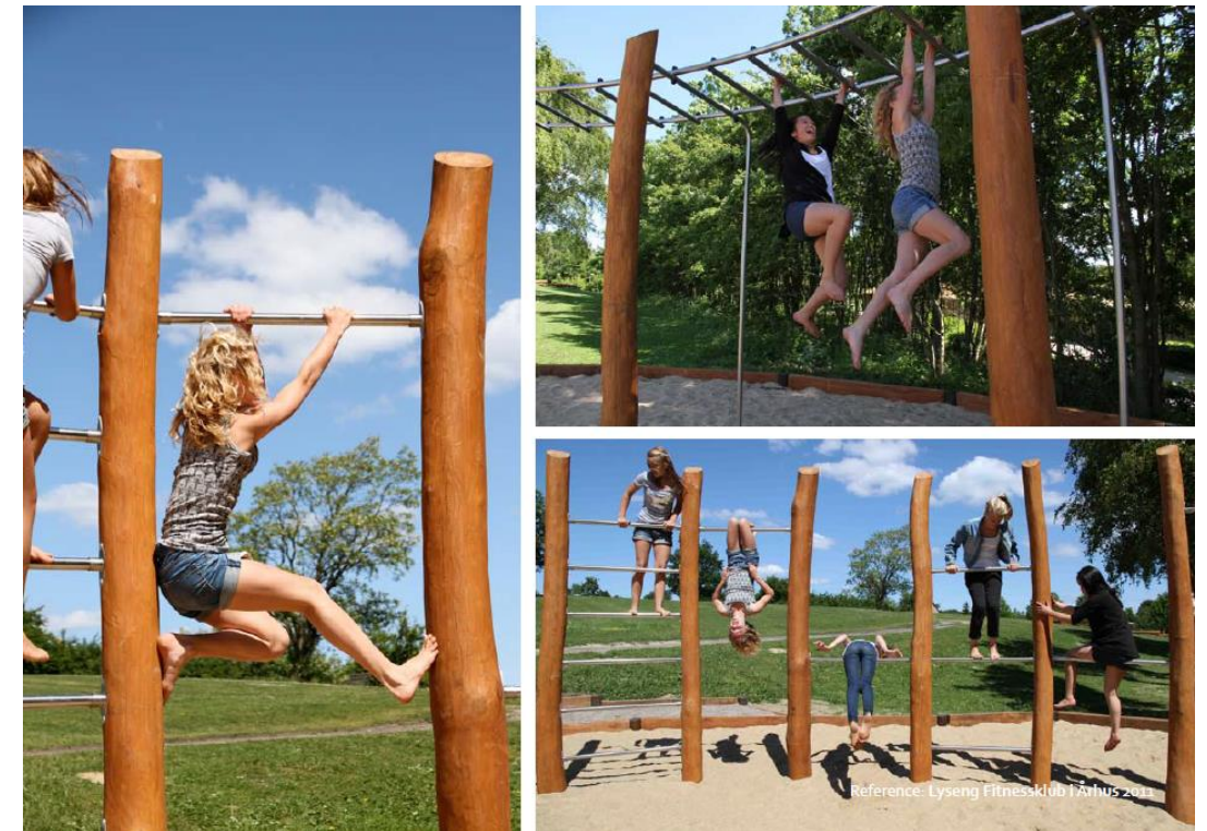
Referencebilleder fra Copla Legepladser Aps (copyright)