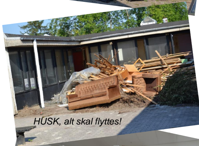
HUSK, alt skal flyttes!