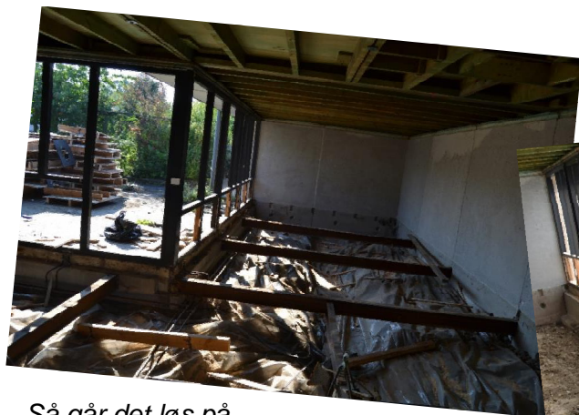
Så går det løs på byggepladsen