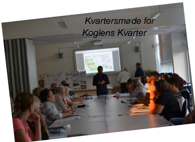
Kvartersmøde for Koglens Kvarter