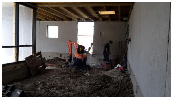
Kloak udføres, klargøring til isolering og dæk