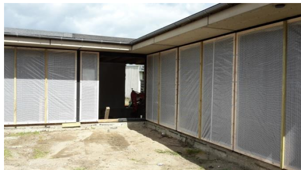
Vinduesfacaden er væk, midlertidig afdækning