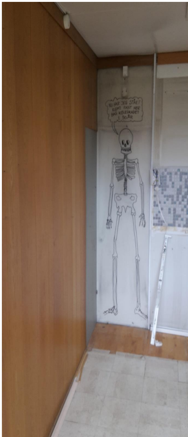
Der viste sig skeletter bag skabene ò .

BILLEDER I OG OMKRING REFERENCEHUSET AUGUST 2016