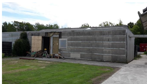
Hoveddøren fjernes, klargøring til teknikskab