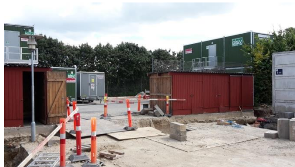
Byggepladsen for første del er nu etableret